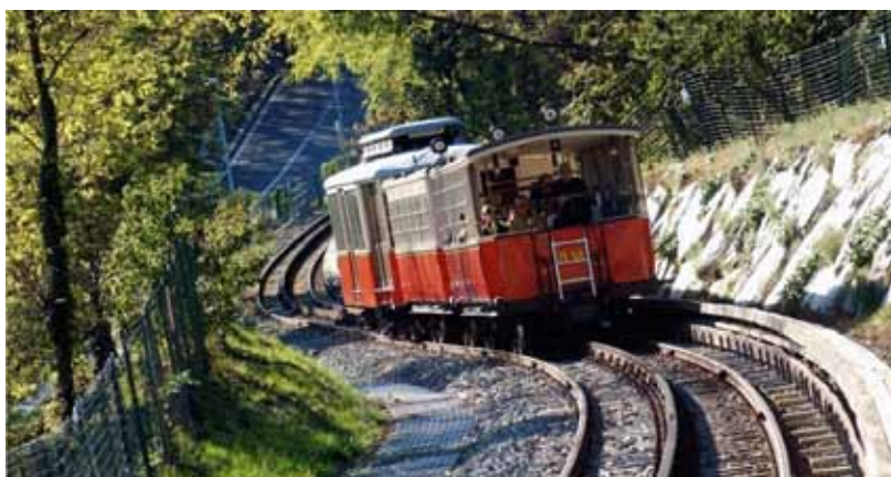
La Tranvia a denti Sasso - Superga

La storica tranvia a dentiera Sassi - Superga è unica in Italia nel suo genere. E' la continuazione di una tradizione ultracentenaria iniziata il 26 aprile 1884 con la prima corsa effettuata dalla funicolare costruita con il sistema Agudio: il trenino era mosso da un motore trainante una fune d'acciaio che scorreva parallelamente al binario su pulegge sistemate lungo il percorso. La linea fu poi trasformata, nel 1934, in tranvia a dentiera con trazione a rotaia centrale ed oggi, completamente ripristinata, offre ai visitatori un viaggio d'altri tempi sulle carrozze originarie e un panorama indimenticabile.