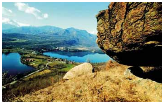
I Laghi di Avigliana dalla Collina di Rivoli

Le escursioni potranno essere annullate qualora non si raggiunga il numero minimo di 6 partecipanti.